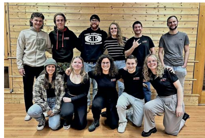
Les anciens et les nouveaux membres du comité JN posent ensemble.