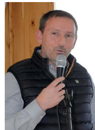
Message remarqué et applaudi par l'auditoire du président de la Commune de Nendaz.