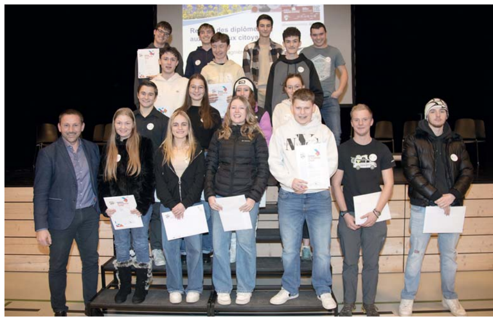
Texte: Commune de Nendaz

Pour souhaiter de manière conviviale la bienvenue dans la vie citoyenne aux uns, et une bienvenue à Nendaz aux autres, la Commune de Nendaz a invité, le 13 décembre dernier, les personnes s'étant installées à Nendaz en 2024 ainsi que les jeunes citoyens âgés de 18 ans, à la salle polyvalente de Haute-Nendaz.