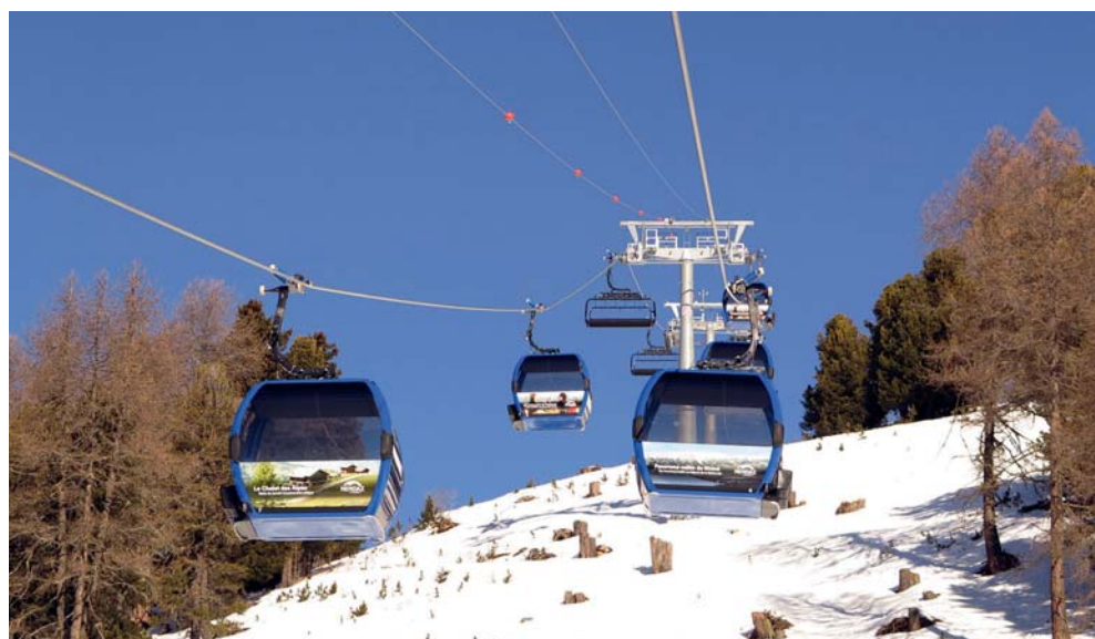
Le télémixte avec 2x4 cabines de 10 places et 48 sièges de 6 places pour un débit horaire de 2050 pers./heure.

puisqu'elle a la particularité d'être desservie à son départ, comme à son arrivée par nos deux établissements emblématiques: le Chalet des Alpes et le Restaurant de Tracouet.