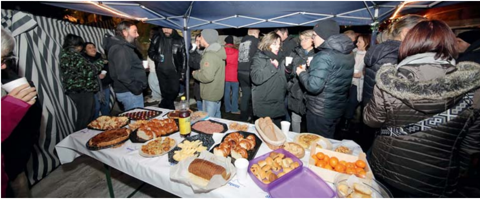
Les habitants de Beuson étaient invités à fêter Noël tous ensemble avant de se retrouver en famille.