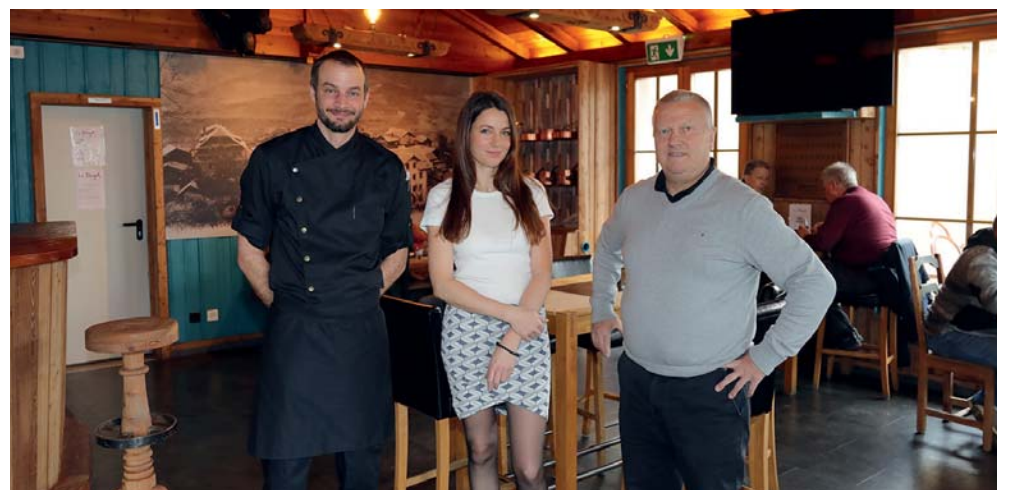
Le 14 décembre, a été fêtée la réouverture du Bargeot pour le plus grand plaisir des habitués.