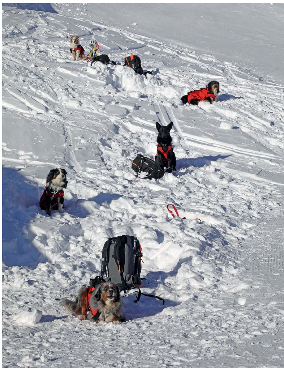
Les chiens attendent sagement leur tour.