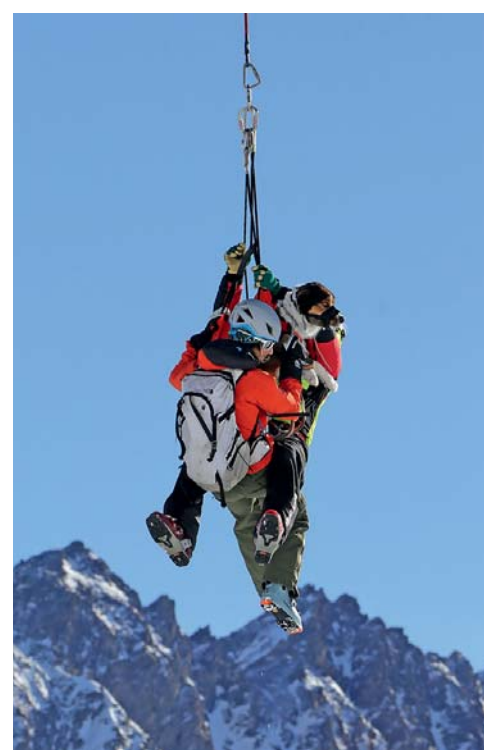
Chiens et conducteurs ont appris à gérer le treuillage, sous l'hélicoptère d'Air-Glaciers.