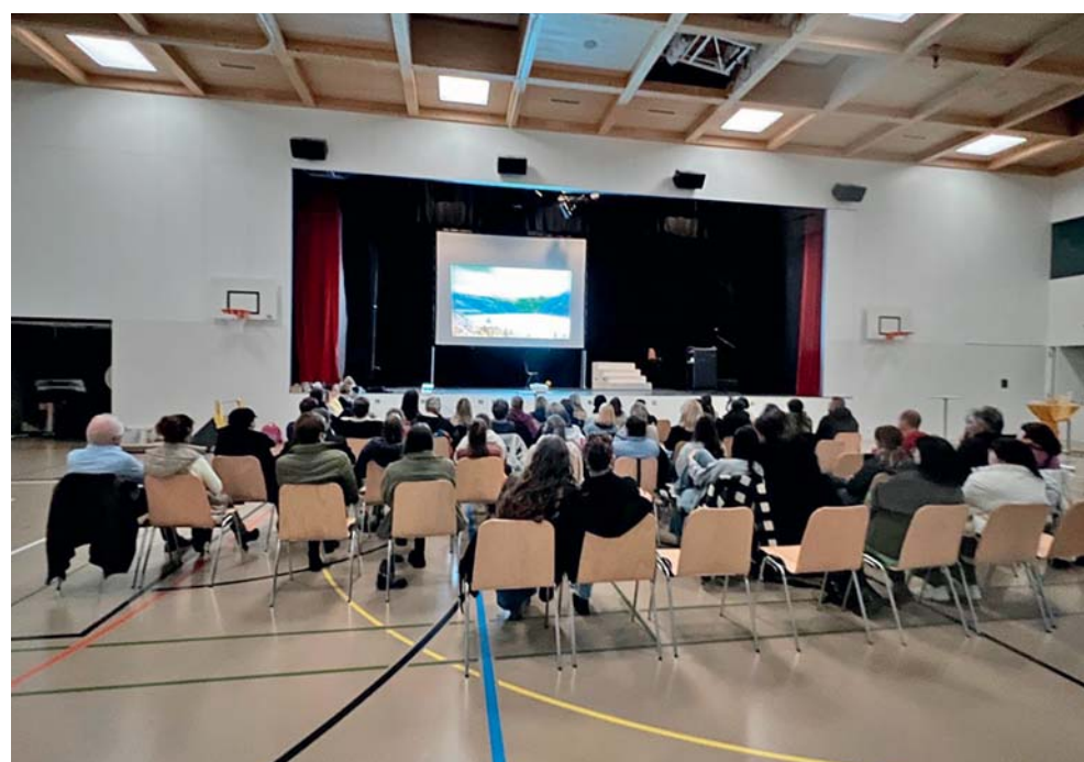
Une belle participation à l'invitation de l'Unipop Printse lors de la soirée du 15 novembre 2024 à Aproz.

L'Unipop Printse vous souhaite une très belle année 2025 riche en activités culturelles.