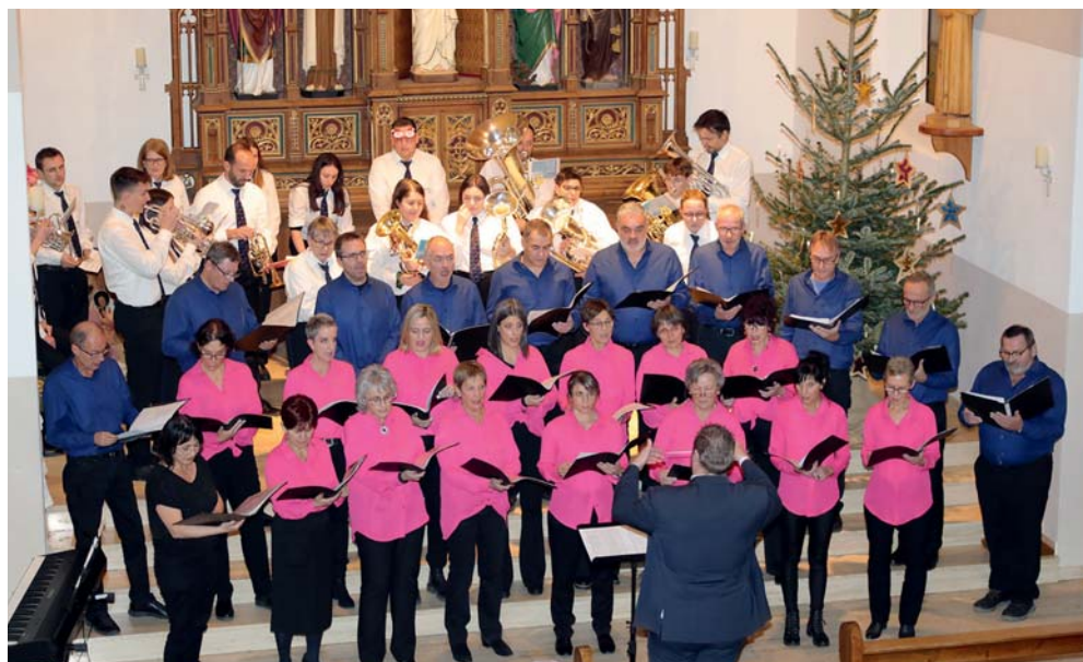
Aproz. Le chœur mixte Le Muguet et L'Echo du Mont. | Photo Guillermin