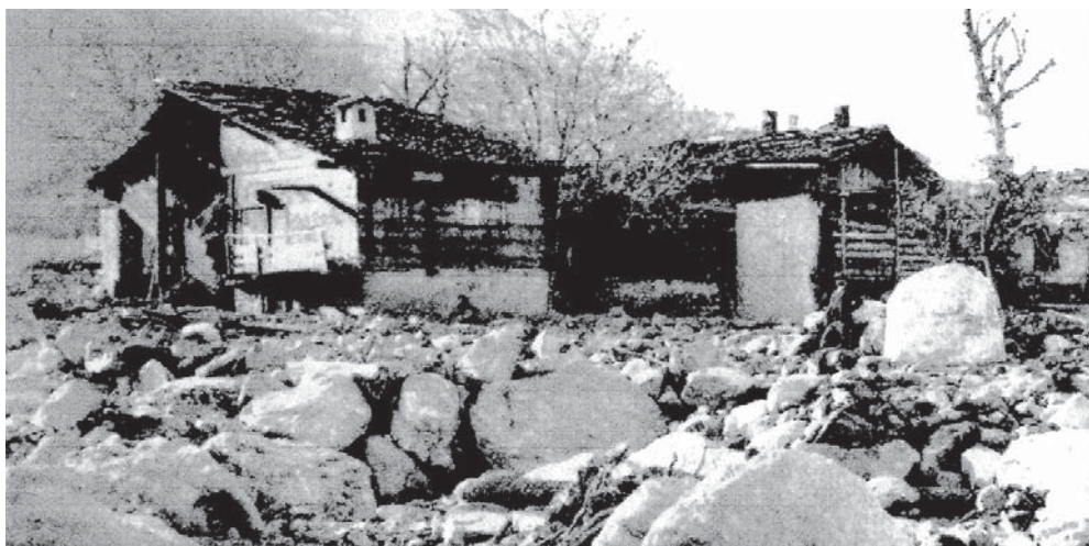
Les débordements de la Fare entre le village de Riddes et les Courteneaux.

Pour ses neveux héritiers, la scierie n'étant plus qu'un vestige du temps passé, la cédèrent à la Fondation Pro Aserblos, pour sa sauvegarde et son entretien et la faire fonctionner occasionnellement pour faire de la démonstration.