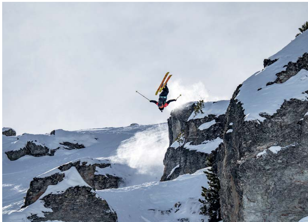
Avez-vous déjà assisté à la Nendaz Freeride FWT Challenger? Le spectacle en vaut le détour!

Il y aura du sport, que ce soit à pratiquer ou juste à regarder, des pauses gourmandes et des journées carnavalesques, de quoi passer de bons moments à Nendaz!