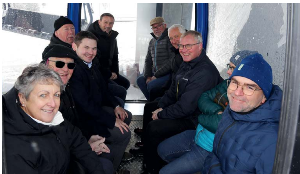
Les premiers passagers montent à bord!

Je vous remercie de votre présence, de votre soutien et vous souhaite une excellente fin de journée.