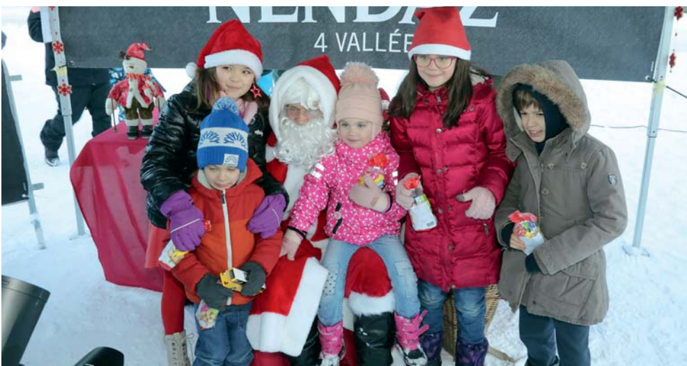
Le Père Noël est descendu de Tracouet en parapente aux Ecluses le 25 décembre pour le grand bonheur des enfants.

EnergyFit ® un programme sur mesure pour ma maison.