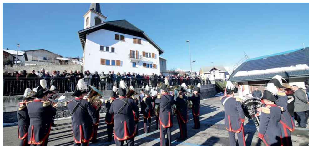
La fanfare La Rosablanc.

avec l'arrivée de 344 nouveaux habitants, portant notre population à 7176 âmes. À vous, chers arrivants, je souhaite une chaleureuse bienvenue. Ce dynamisme reflète l'attractivité de notre territoire, mais