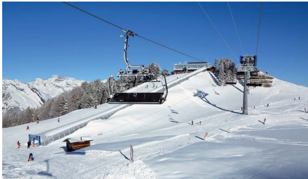
Le site de Tracouet avec le nouveau télémixte, le tunnel d'accès à l'aire d'enseignement pour débutants (cheminement piétons aller/retour et tapis roulant à la montée), et les panneaux solaires sur le toit du restaurant.