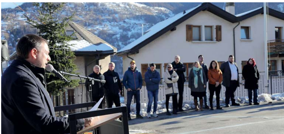
Le Conseil communal à l'écoute.