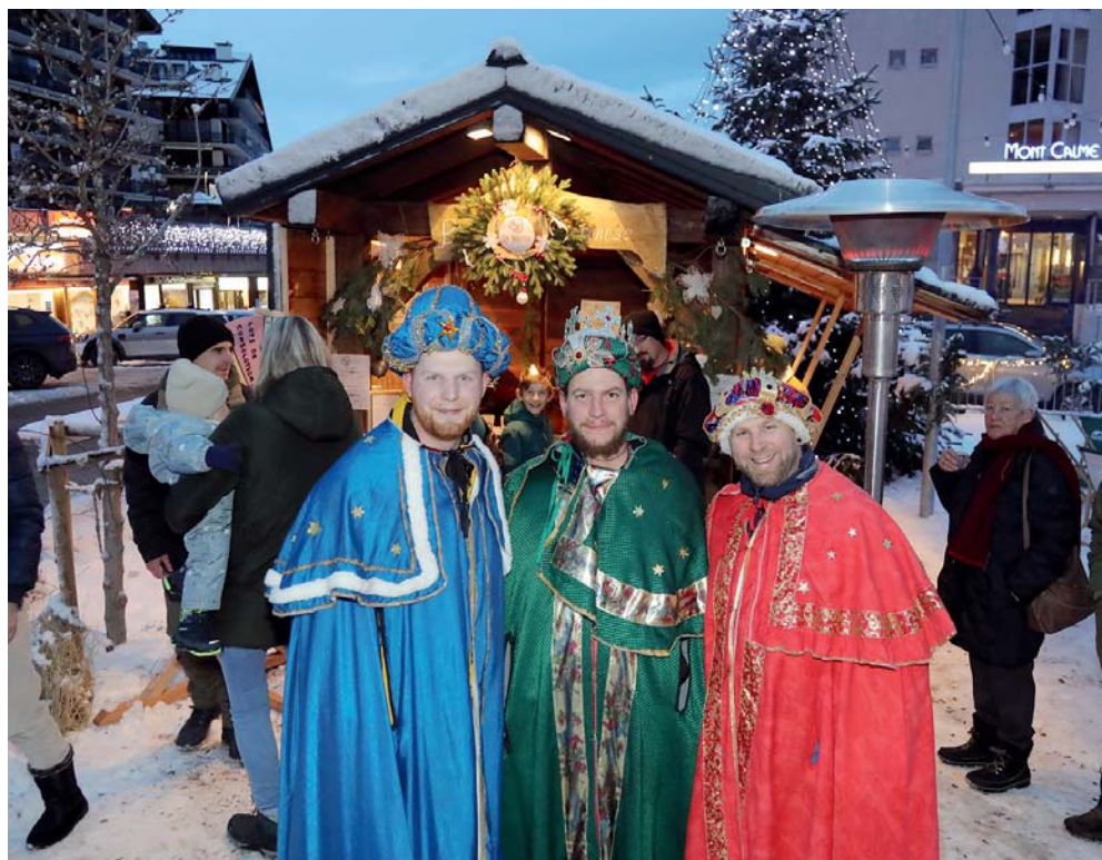
Pour fêter l'Épiphanie, les Rois Mages sont même venus sur la Place du Marché, à la grande joie des petits et des grands.