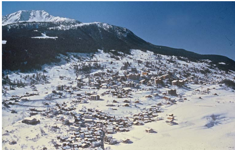
Souvenirs, souvenirs...