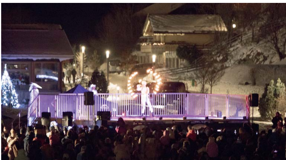
Spectacle sur la plaine des Écluses pour le passage en 2025.