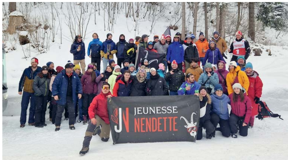
Les membres de la Jeunesse Nendette et des Amis à Adelboden.