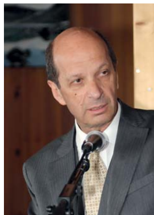
Message de la Berne fédérale de M. Beat Rieder, conseiller aux Etats.

Pour les skieurs et les promeneurs, cette nouvelle liaison raccourcit sensiblement le temps de parcours entre Nendaz et Siviez tout en le rendant beaucoup plus confortable. Mais avec ce nouveau télémixte nous avons également pensé à nos hôtes fins gastronomes amateurs de bonne cuisine et de bons vins