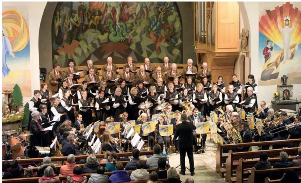
Haute-Nendaz. Le chœur St-Michel et La Liberté de Salins.