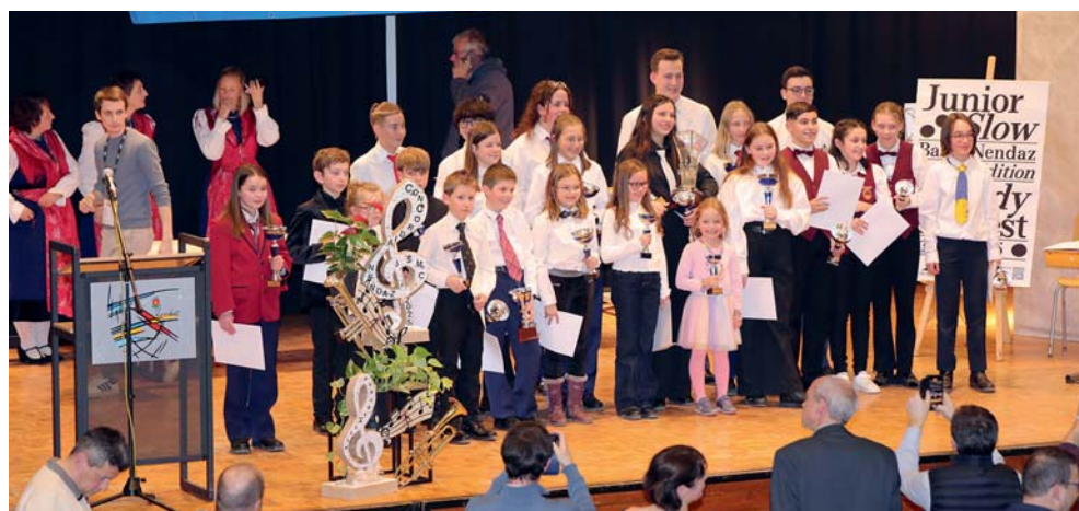
Les solistes classés en premières, deuxième et troisième places de toutes les catégories.

Société organisatrice, la fanfare La Concordia de Nendaz renouvelle ses chaleureux remerciements aux autorités, sociétés amies, sponsors et bénévoles qui ont contribué au plein succès de la manifestation.