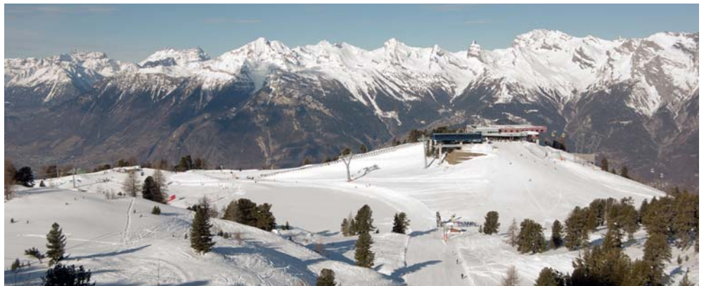
Grâce au nouveau télémixte, l'accès au site de Tracouet est désormais plus aisé pour les skieurs et piétons en provenance de Siviez.