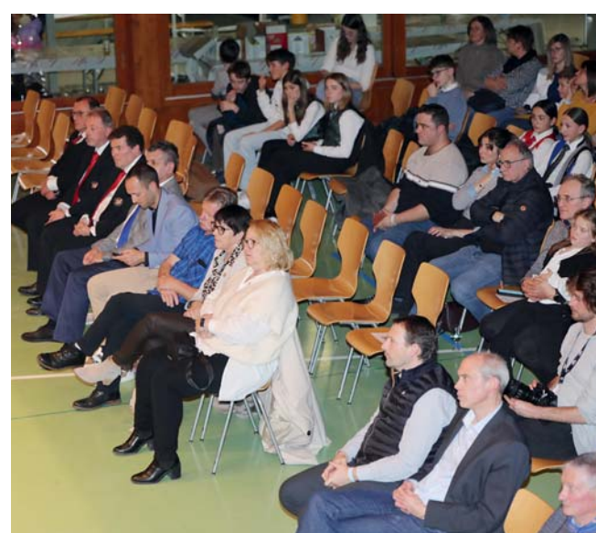
Les représentants ACMV, les autorités cantonales et communales.