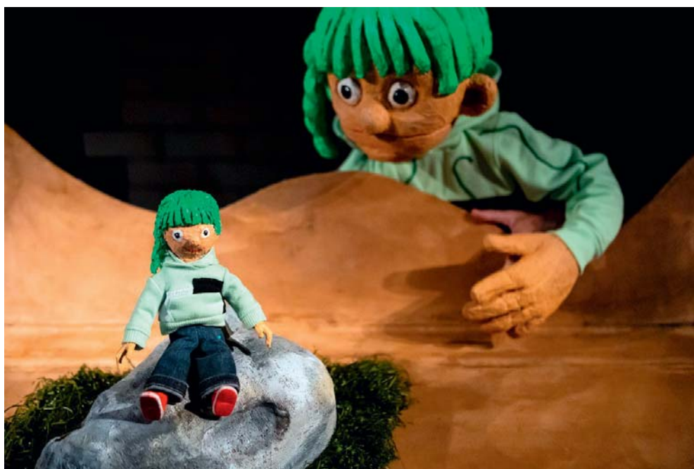
«La boîte à goûter», un spectacle tout public à découvrir à Nendaz.

les adultes (inscriptions obligatoires auprès de Nendaz Tourisme jusqu'à la veille 16h)