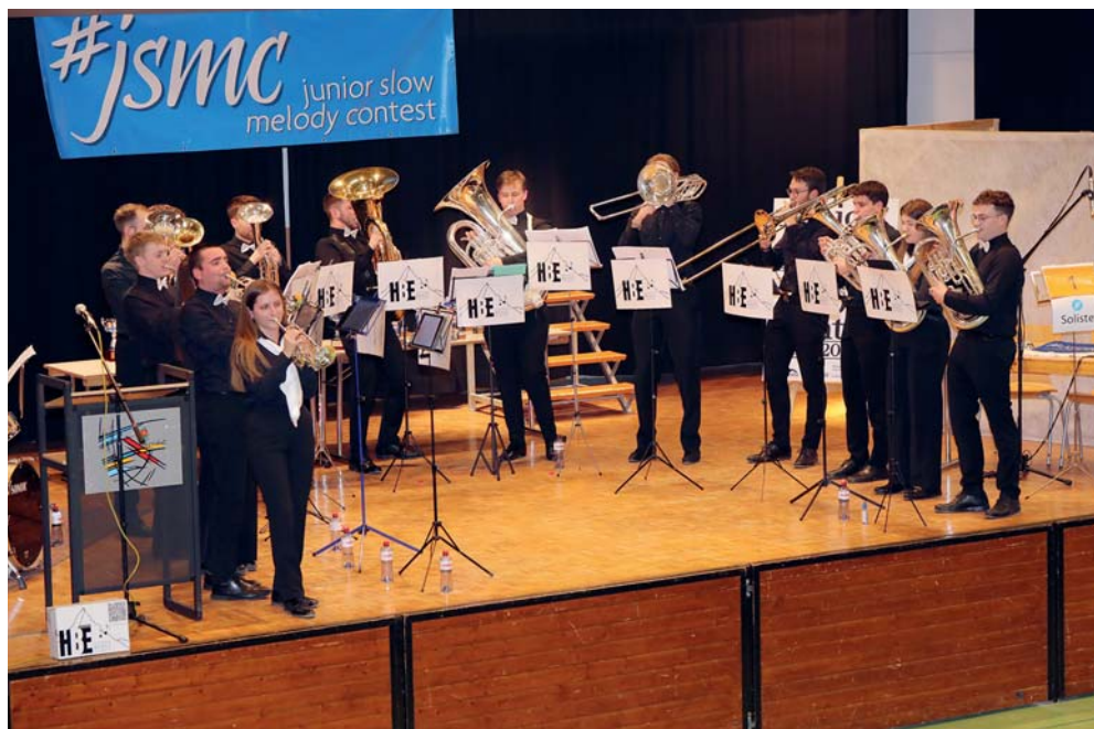
Horizon Brass Ensemble.