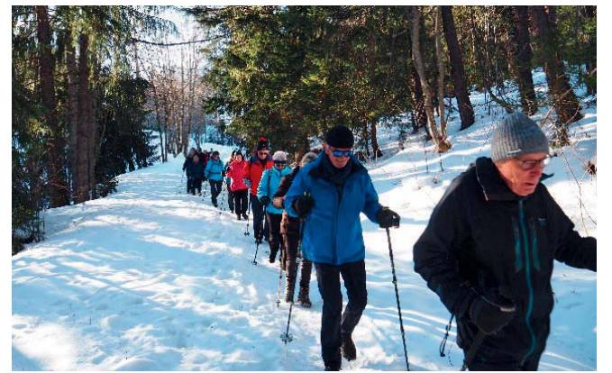
Texte et photos: comité des Trotteurs

L'hiver touche bientôt à sa fin. Eh bien profitons encore des beaux jours et des espaces enneigés en rejoignant les Trotteurs de la Printze . Chaque semaine, une joyeuse équipe de gais lurons, sous la responsabilité de coachs formés par Pro Senectute et certifiés ESA, se balade à la découverte de notre beau pays. Les plus téméraires, raquettes aux pieds, arpentent les vallées environnantes tous les lundis, tandis que les baladeurs pratiquent chaque jeudi après-midi la randonnée douce sur neige.