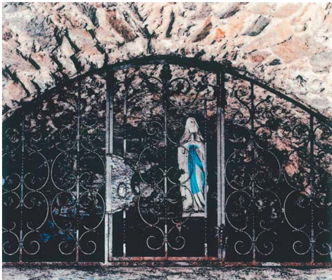
Source de l'érable sous l'église d'Isérables.