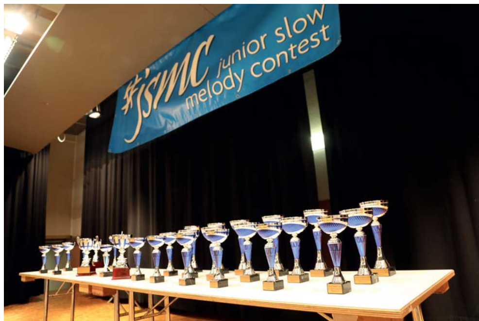
Coupes des premières, deuxième et troisième places.