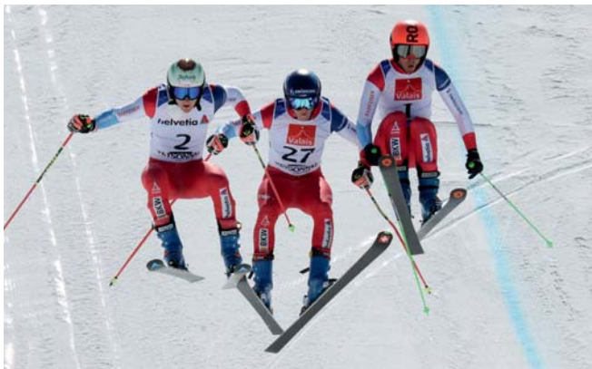
Bon succès populaire, le beau temps était de la partie. Une compétition toujours très spectaculaire!